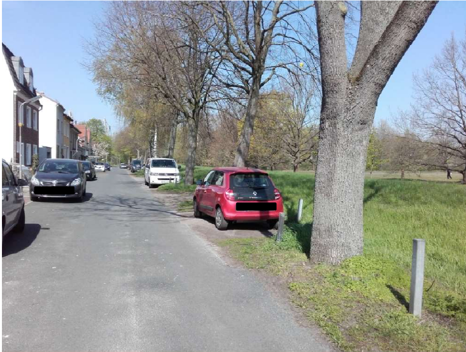
Beispiel Abschnitt A