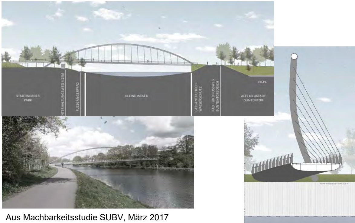
Aus Machbarkeitsstudie SUBV, März 2017