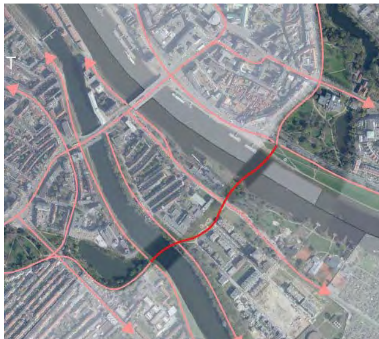
Aus Machbarkeitsstudie SUBV, März 2017