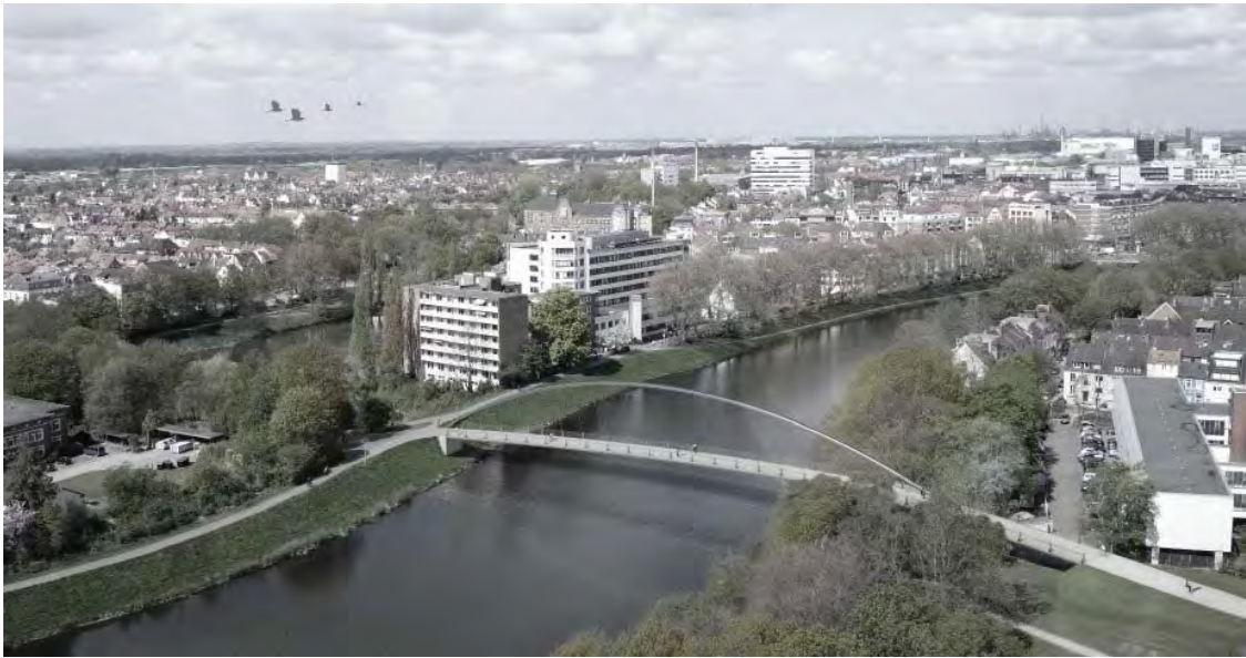
Aus Machbarkeitsstudie SUBV, März 2017