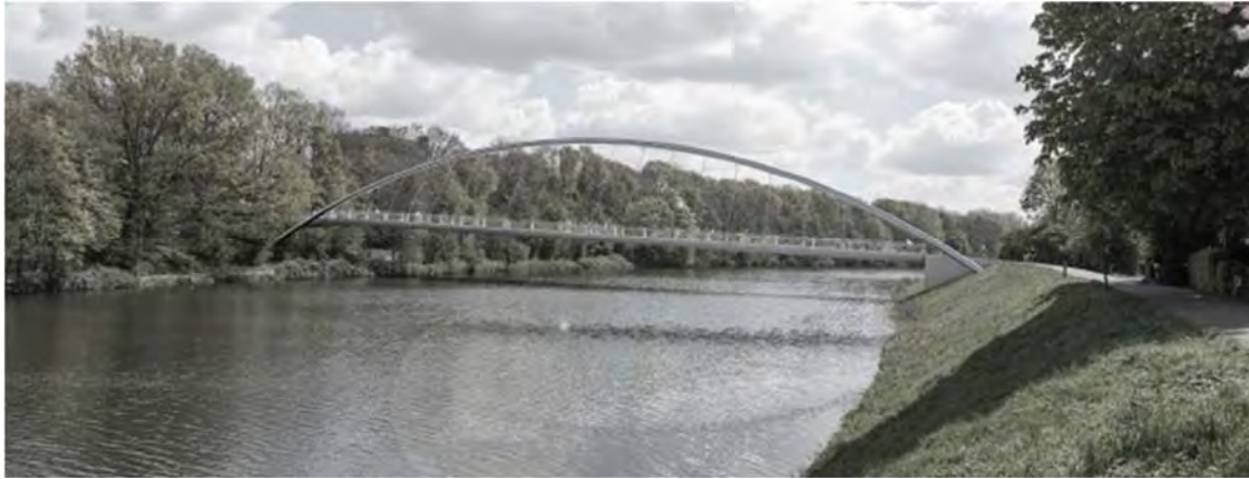
Aus Machbarkeitsstudie SUBV, März 2017