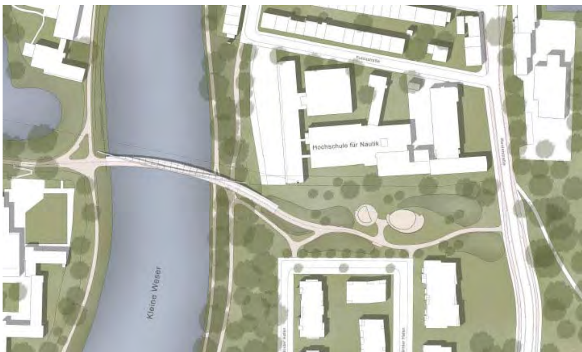
Aus Machbarkeitsstudie SUBV, März 2017