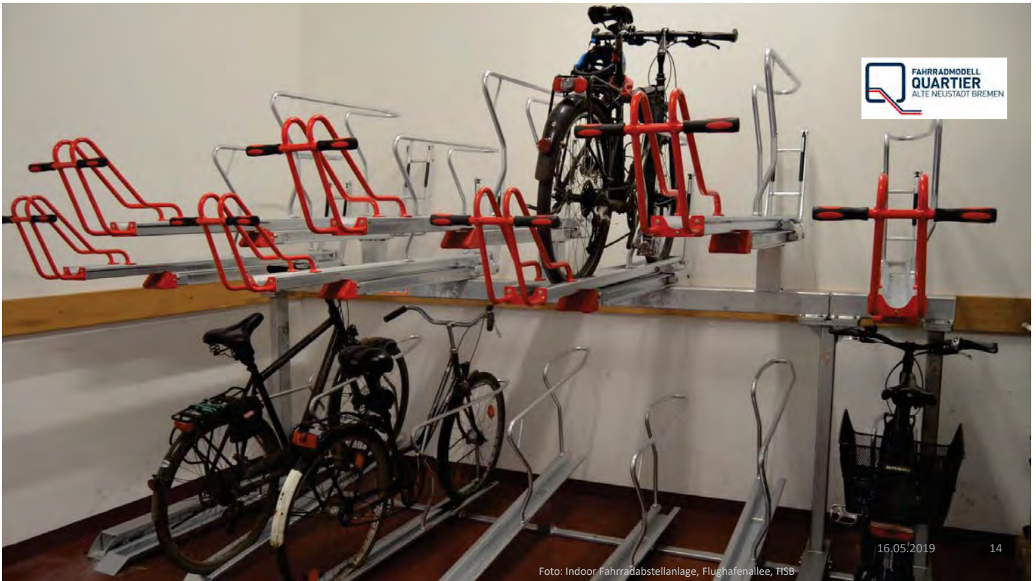
Foto: Indoor Fahrradabstellanlage, Flughafenallee, HSB