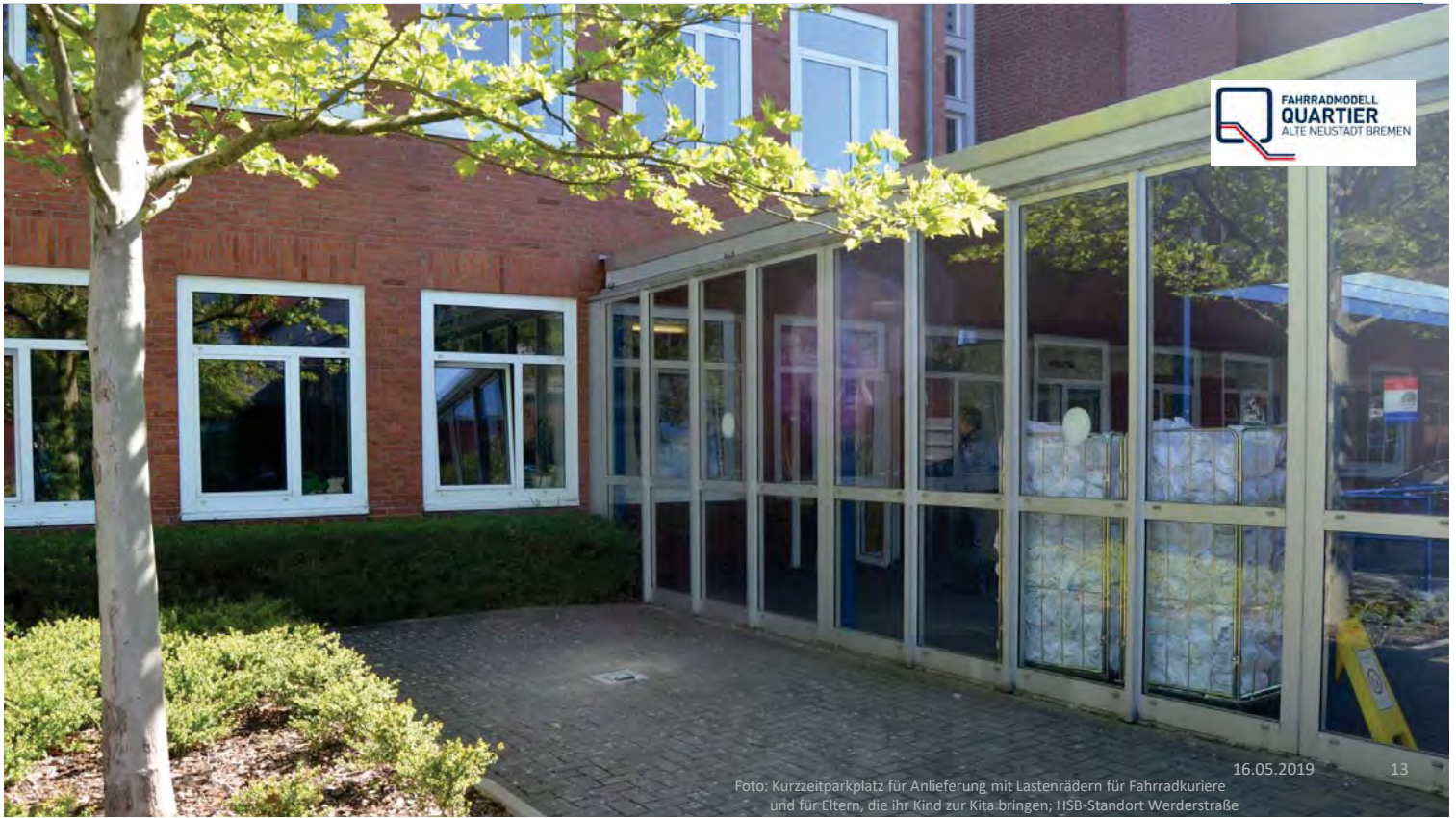
Foto: Kurzzeitparkplatz für Anlieferung mit Lastenrädern für Fahrradkuriere und für Eltern, die ihr Kind zur Kita bringen; HSB-Standort Werderstraße