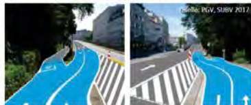
Quelle: Masterplan Green City Handlungsfeld 1; 1.2.b Radroute Wallring Innenstadt